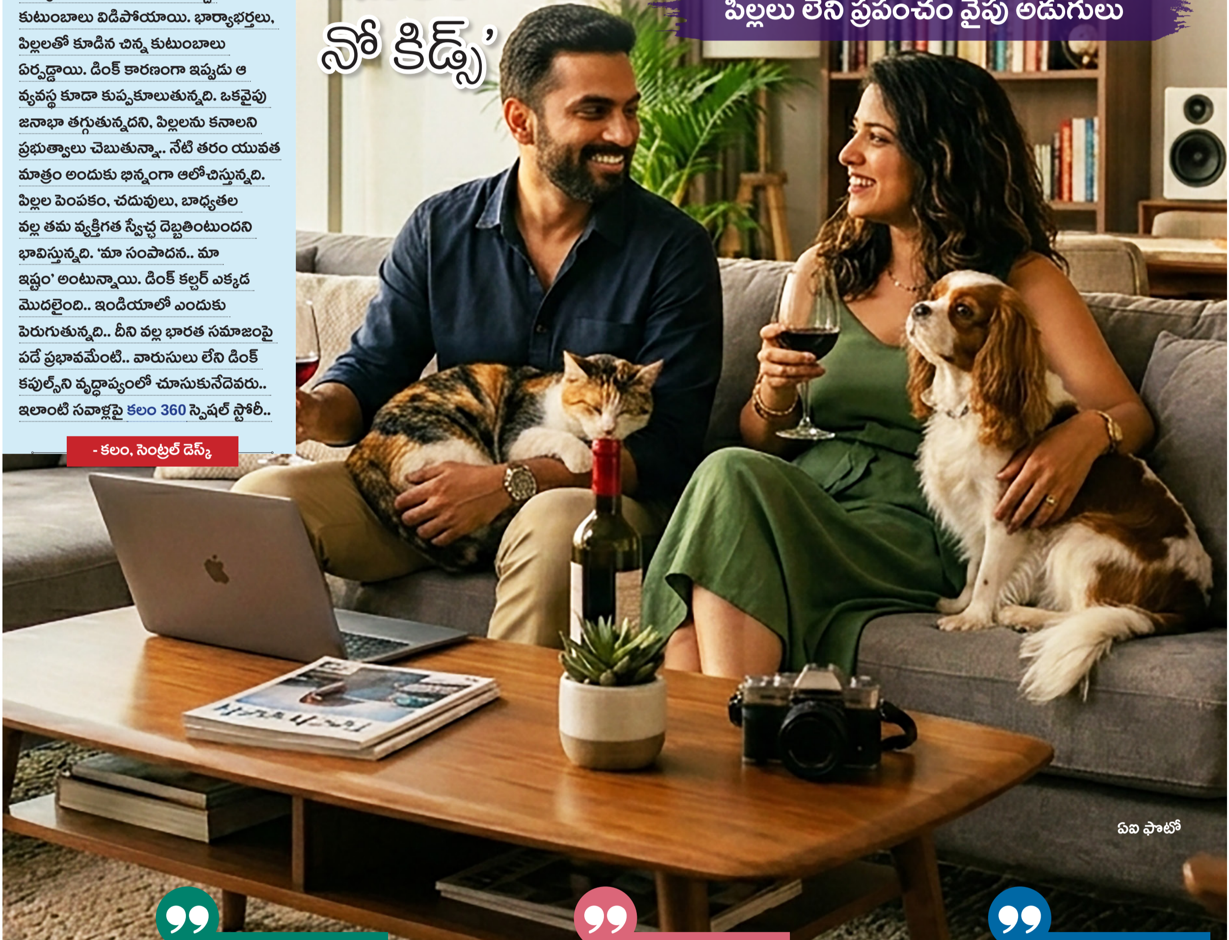
- కలం, సెంట్రల్ డెస్క్

వ్యక్తిగత స్వేచ్ఛకే యువత ప్రాధాన్యం బాధ్యతలను భారంగా భావిస్తున్న జంటలు పిల్లలు లేని ప్రపంచం వైపు అడుగులు