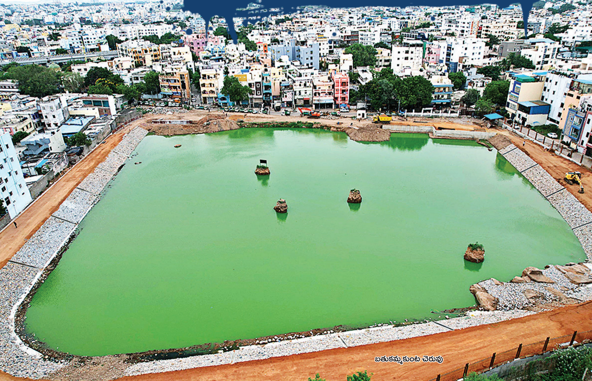
బతుకమ్మ కుంట చెరువు