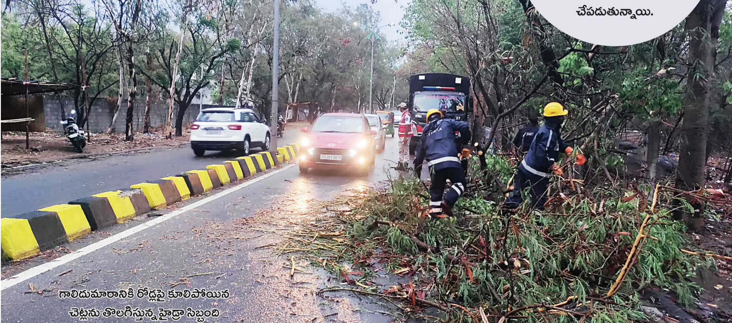
గాలిదుమారానికి రోడ్లపై కూలిపోయిన చెట్లను తొలగిస్తున్న హైద్రా సిబ్బంది

అక్కడికి వెళ్లి బాధితులతో మాట్లాడారు. ● కాంగ్రెస్ పాలన నిజాం కంటే ఘోరంగా ఉన్నదని బీజేపీ ఎంపీ ఈటల రాజేందర్ విమర్శించారు. ● కాంగ్రెస్ ప్రభుత్వం ద్వంద్వ నీతి ప్రదర్శిస్తున్నదని బీఆర్ఎస్ లీడర్ కేటీఆర్ విమర్శించారు. సర్కార్కు నిజంగా చిత్తశుద్ధి ఉంటే.. సామాన్యుల ఇళ్ల కంటే ముందు మంత్రులు, కాంగ్రెస్ ఎమ్మెల్యేల అక్రమ కట్టడాలను కూల్చివేయాలని సవాల్ విసిరారు. పలువురు మంత్రులు, కాంగ్రెస్ లీడర్ల ఫామిహాస్ను బఫర్ జోన్లో ఉన్నాయని ఆరోపించారు.