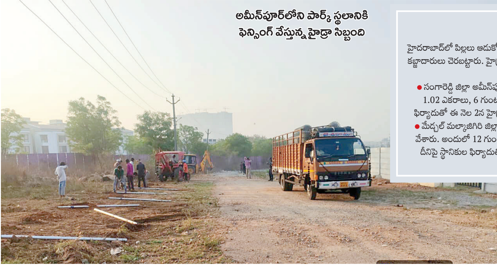
అమీన్పూర్లోని పార్క్ స్థలానికి ఫెన్సింగ్ వేస్తున్న హైద్రా సిబ్బంది