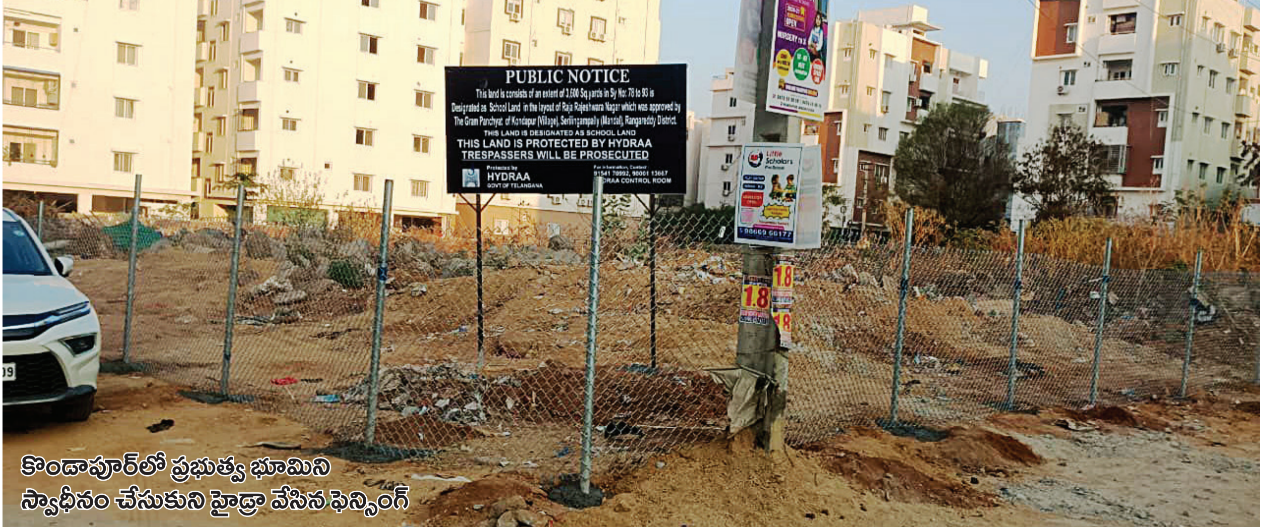
కొండాపూర్లో ప్రభుత్వ భూమిని స్వాధీనం చేసుకుని హైద్రా వేసిన ఫెన్సింగ్