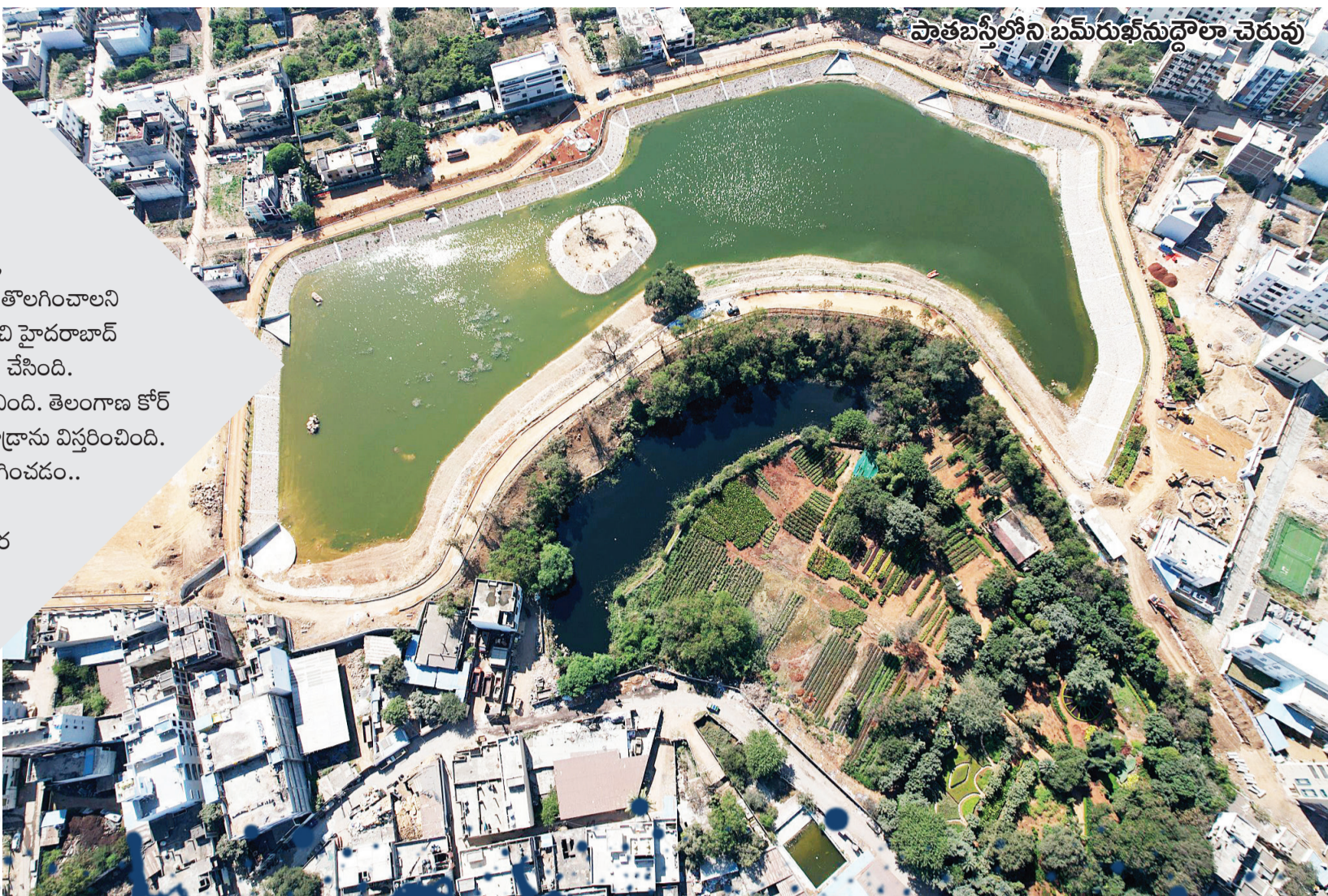
పాతబస్స్ లోని బమ్మరుఖ్ సుద్దాలా చెరువు