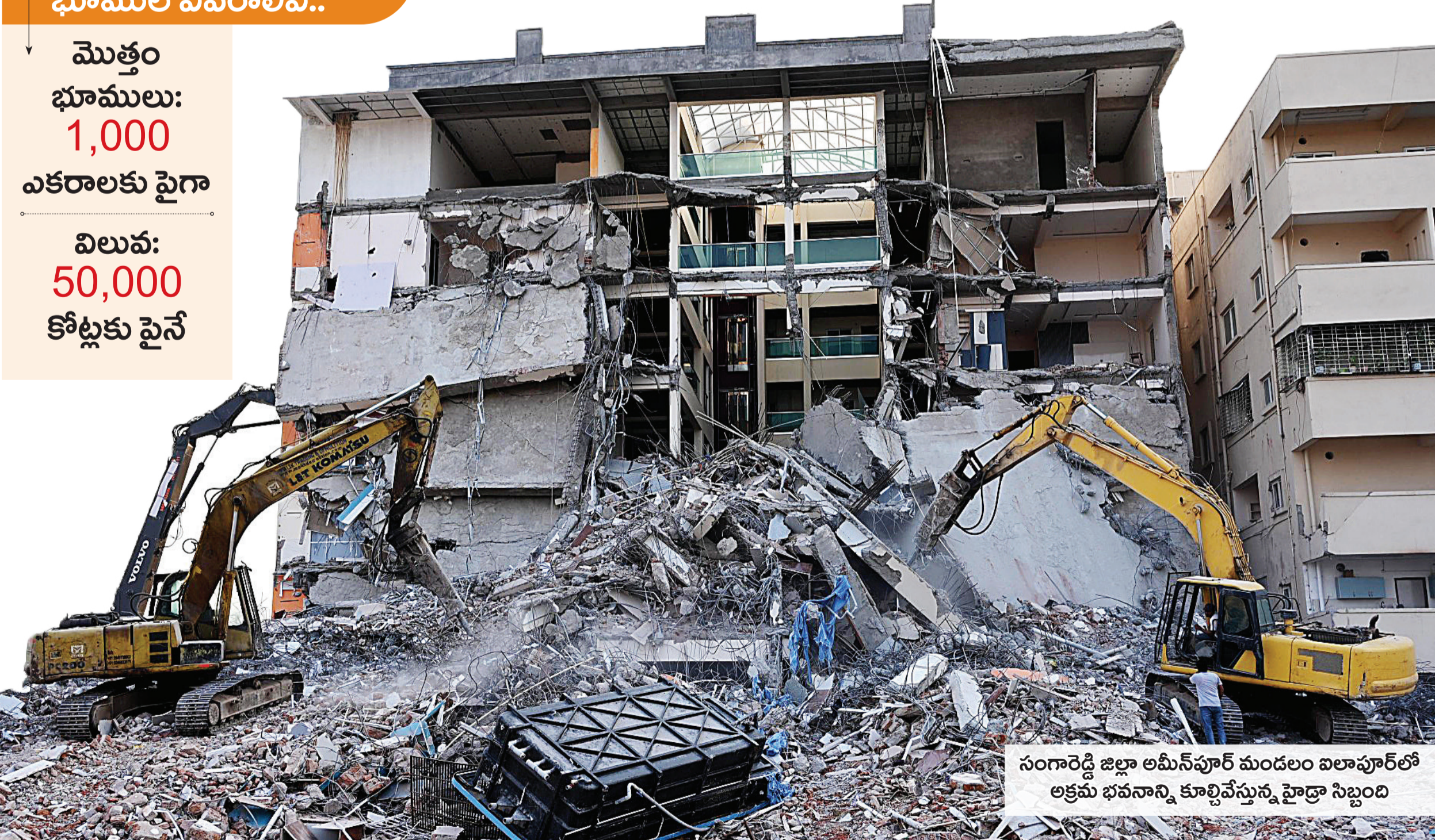
సంగారెడ్డి జిల్లా అమీన్ పూర్ మండలం ఐలాపూర్ లో అక్రమ భవనాన్ని కూల్చివేస్తున్న హైద్రా సిబ్బంది

మొత్తం భూములు: 1,000 ఎకరాలకు పైగా విలువ: 50,000 కోట్లకు పైనే