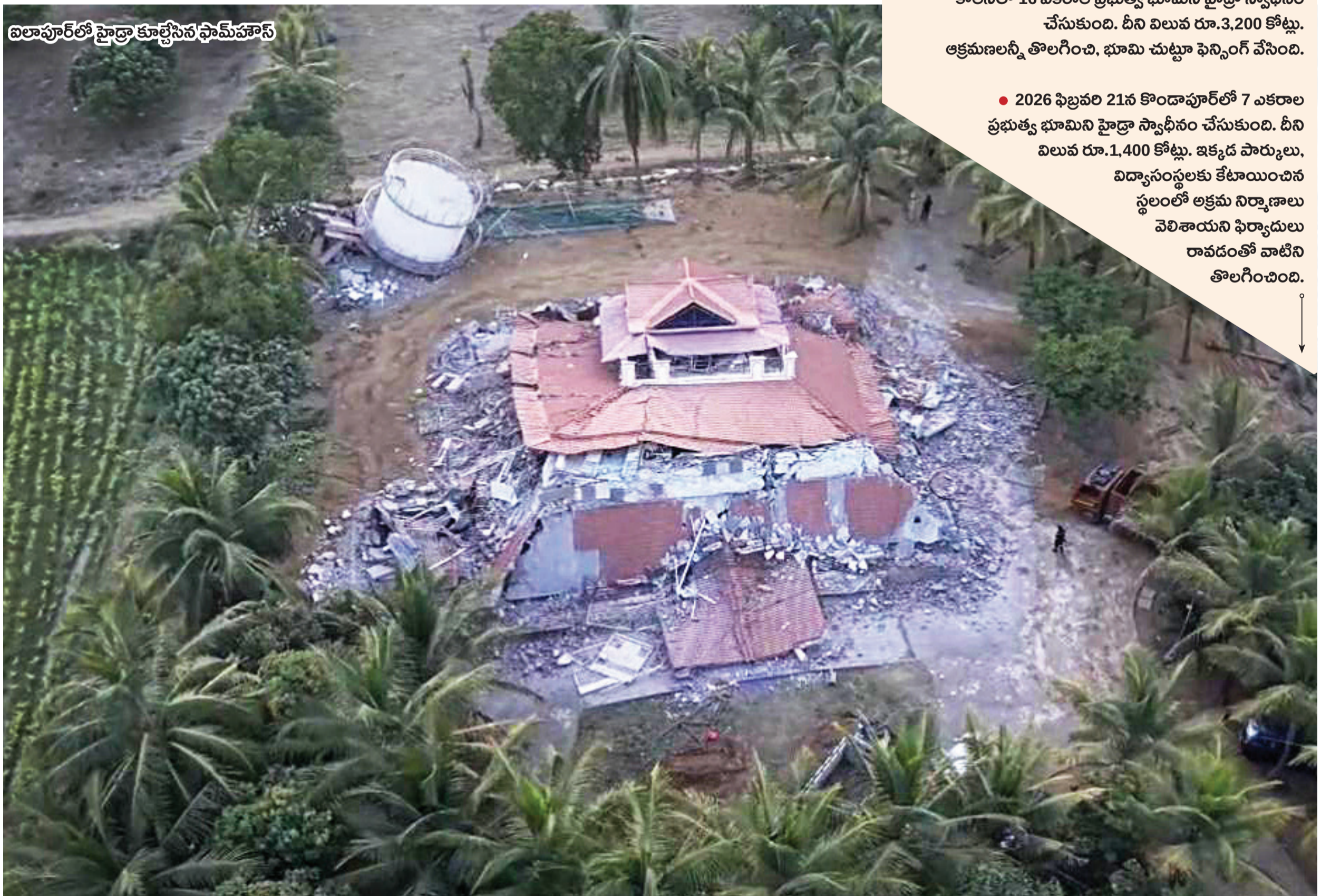
విలాపూర్లో హైద్రా కూల్చేసిన ఫామ్ హౌస్

హైదరాబాద్లో ఆఖరికి రోడ్డు కూడా కట్టాలకు గురవుతున్నాయి. కట్టాదారులు రోడ్లను ఆక్రమించి తాత్కాలిక షెడ్లు ఏర్పాటు చేసి షాపులు పెడుతున్నారు. కొందరు ఇళ్లు కూడా కడుతున్నారు. ఇలాంటి ఫిర్యాదులు పెరగడంతో హైద్రా చర్యలు తీసుకుంటున్నది. ● మేడ్చల్ మల్కాజిగిరి జిల్లా దుండిగల్ మండలం జౌరంపేట గ్రామ పరిధిలో గండిమైనమ్మ-మియాపూర్ ప్రధాన రహదారిపై ఓ వ్యక్తి ఆక్రమణలకు పాల్పడి తాత్కాలిక షెడ్లు వేశాడు. వాటిని అడ్డెక్కు ఇచ్చాడు. హైద్రాకు ఫిర్యాదు రావడంతో గత నెల 31న ఆ షెడ్లను తొలగించింది. ● హైదరాబాద్ శివారు బాచుపల్లిలో ప్రణీత ఆంటీల్వ్యా పేరుతో వెంచర్ ఏర్పాటు చేశారు. అందులో విల్లాలు నిర్మించారు. నిర్వాహకులు దాన్ని గేటెడ్ కమ్యూనిటీగా పేర్కొంటూ రహదారికి అడ్డంగా భారీ గోడ నిర్మించారు. దీంతో మల్లంపేట ఓఆర్ఆర్ ఎగ్జిట్ 4 నుంచి ప్రగతి నగర్ వెళ్లాల్సిన వాహనదారులు అదనంగా 5 కి.మీ. ప్రయాణించాల్సి వచ్చింది. దీనిపై ఫిర్యాదు అందడంతో హైద్రా గత నెల 9న రంగంలోకి దిగి గోడను కూల్చి వేసి, పబ్లిక్ రోడ్డును అందుబాటులోకి తెచ్చింది. ● సికింద్రాబాద్లోని న్యూబోయిగూడలో రోడ్డును ఆక్రమించి కడుతున్న ఇల్లును ఈ నెల 8న హైద్రా కూల్చి వేసింది.