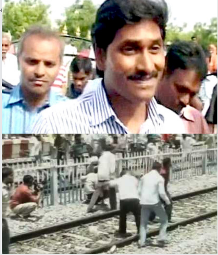
మానుకోట ఘటన నాటి ఫోటోలు

కాంగ్రెస్ నుంచి వైదొలిగి 2011 మార్చి నెలలో వైఎస్సార్ కాంగ్రెస్ పార్టీని స్థాపించిన వైఎస్ జగన్.. మొదట్లో తెలంగాణ ఏర్పాటు అంశంపై మౌనంగా ఉన్నారు. దీనిపై తెలంగాణవాదులు ప్రశ్నించిన ప్రతిసారి దాటవేసేవారు. ఇదే క్రమంలో 2011 మే నెలలో 'ఓదార్పు యాత్ర' పేరిట మానుకోటకు జగన్ టీమ్ బయలుదేరింది. ఆ సమయంలో తెలంగాణ ఉద్యమం కీలక దశలో ఉంది. అలాంటి సిట్టువేషంలో జగన్ మానుకోటలో పర్యటించడాన్ని ఎక్కడికక్కడ తెలంగాణవాదులు అడ్డుకున్నారు. ఇప్పటికీ జగన్ పేరు చెప్పగానే తెలంగాణలో గుర్తుకు వచ్చే సంఘటనగా ఇది నిలిచిపోయింది. 2013లో సమైక్యాంధ్రకే వైఎస్సార్ సీపీ ఓటు అంటూ జగన్ ప్రకటించడంతో.. తెలంగాణలో ఆ పార్టీ క్రమేణా కనుమరుగైపోయింది.