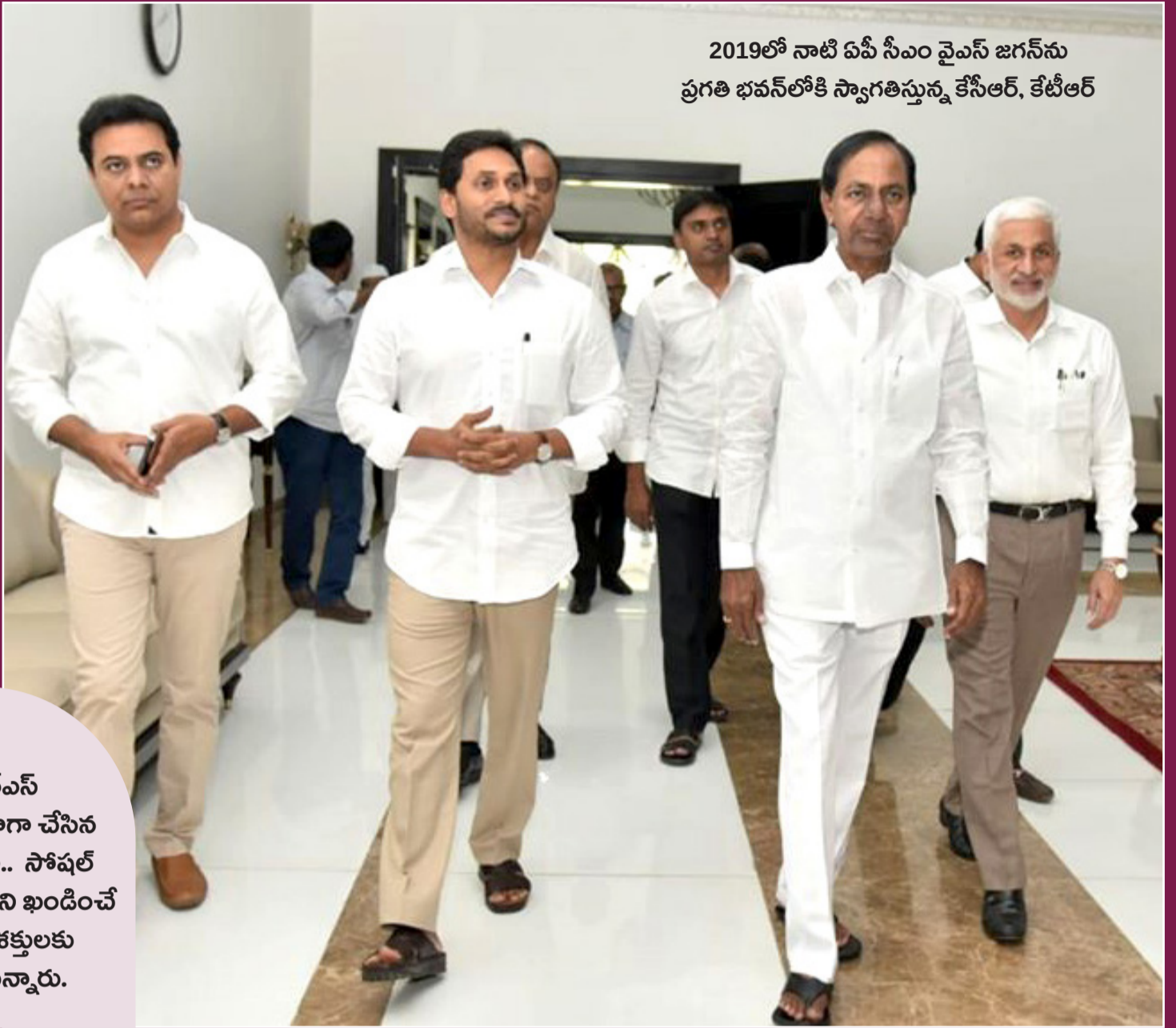
2019లో నాటి ఏపీ సీఎం వైఎస్ జగన్ ను ప్రగతి భవన్ లోకి స్వాగతిస్తున్న కేసీఆర్, కేటీఆర్