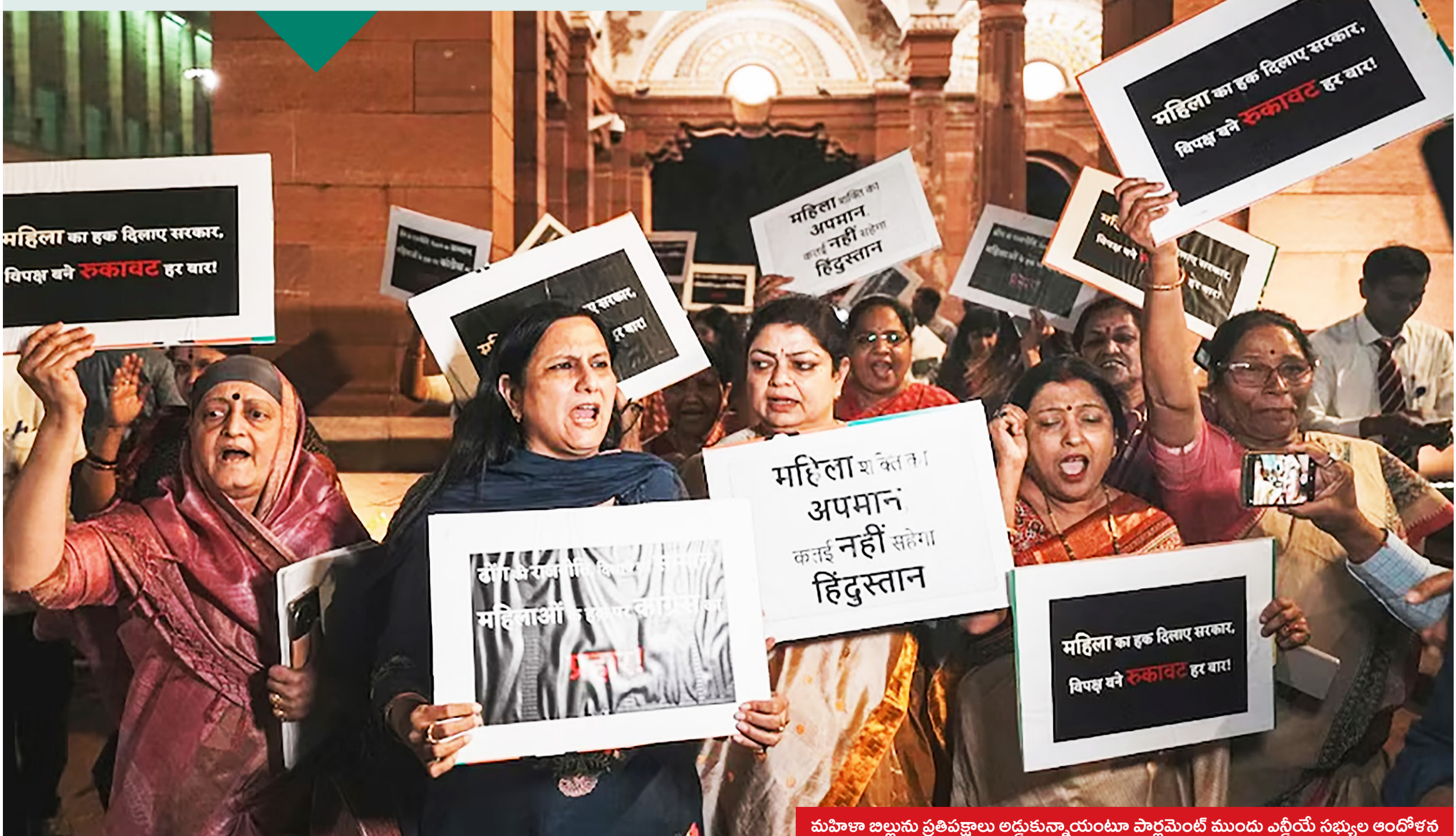
మహిళా బిల్లును ప్రతిపక్షాలు అడ్డుకున్నాయంటూ పార్లమెంట్ ముందు ఎన్టీయే సభ్యుల ఆందోళన

మహిళా రిజర్వేషన్ బిల్లుకు కాంగ్రెస్ సహా విపక్షాలు అడ్డుపడ్డాయని ఆరోపిస్తూ ఎన్టీయే మహిళల పార్లమెంట్ ఆవరణలో షకార్తులతో నిరసనలకు దిగారు. మహిళల నోటి దగ్గరకు వచ్చిన బువ్వను మట్టిపాలు చేశాయంటూ విపక్ష పార్టీలపై విమర్శలు చేశారు. రాజ్యాంగ విరుద్ధంగా రాహుల్ గాంధీ కుట్రకు పాల్పడ్డారని ఆరోపించారు. మోడీ ప్రభుత్వం అవకాశాలు ఇవ్వడానికి ప్రయత్నిస్తే ప్రతిపక్షాలు మాత్రం అడ్డుకునే కుట్రలు చేశాయన్నారు. కేవలం ఇండియా కూటమి కారణంగానే మహిళా రిజర్వేషన్ బిల్లు సాకారం కాలేదని దుయ్యబట్టారు. మహిళలపై ఇండియా కూటమి పార్టీలు ఏ రకంగా వ్యతిరేక భావనతో ఉన్నాయో ఈ అంశం అద్దం పడుతున్నదని ఎన్టీయే మహిళా ఎంపీలు వ్యాఖ్యానించారు. మహిళకు రాజకీయ అవకాశాలు ఇవ్వకుండా అడ్డుకున్న విపక్షాలకు రాజీయే ఎన్నికల్లో మహిళా ఓటర్ల బుద్ధి చెప్పారని వారు హెచ్చరించారు.