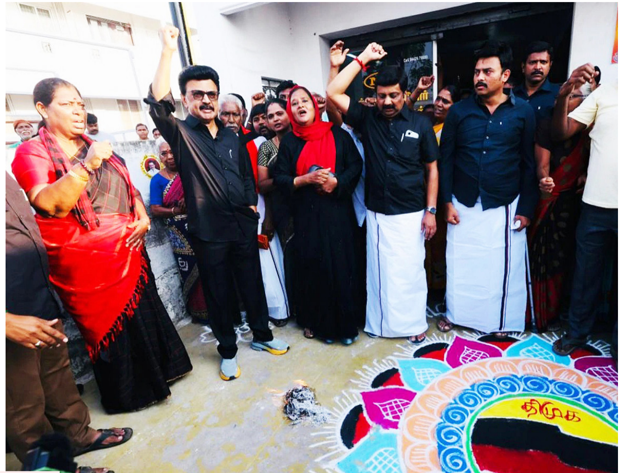
డీలిమిటేషన్ డ్రాఫ్ట్ కాపీని చెన్నైలో తగలబెడుతున్న తమిళనాడు సీఎం స్టాలిన్

రాజ్యాంగ సవరణ బిల్లు వీగిపోవడంతో అధికార ఎన్టీయే కూటమి, ప్రతిపక్ష ఇండియా కూటమి పార్టీల మధ్య జేమ్స్ గేమ్ జోరందుకుంది. విపక్షాలు అడ్డుపడిన కారణంగానే మహిళా రిజర్వేషన్ బిల్లుకు ప్రోత్సాహం ఇప్పటికే ఎన్టీయే మహిళా ఎంపీలు ఆరోపిస్తున్నారు. కాంగ్రెస్ కారణంగానే మహిళా బిల్లుకు అటంకాలు ఏర్పడాయని విమర్శలను బీజేపీ తీవ్రతరం చేస్తున్నది. రాజ్యాంగాన్ని మార్చాలన్న కుట్రకు మునుగుగా మహిళా రిజర్వేషన్ బిల్లును ముందుకు తీసుకొచ్చిందని కాంగ్రెస్ సహా విపక్షాలు కొంటర్ ఇస్తున్నాయి. ఈ దేశానికి జరిగే పెను ప్రమాదాన్ని నివారించామని చెబుతున్నాయి. మహిళా రిజర్వేషన్ లకు తాము వ్యతిరేకం కాదని, ఇప్పటికిప్పుడు డీలిమిటేషన్ బిల్లుతో లింకు పెట్టకుండా విడిగా బిల్లు పెడితే ఇప్పుడున్న 543 స్థానాల్లోనే మహిళలకు 33% సీట్లను రిజర్వు చేయడానికి సంపూర్ణంగా మద్దతు పలుకుతామని బీజేపీకి కొంటర్ ఇస్తున్నాయి.