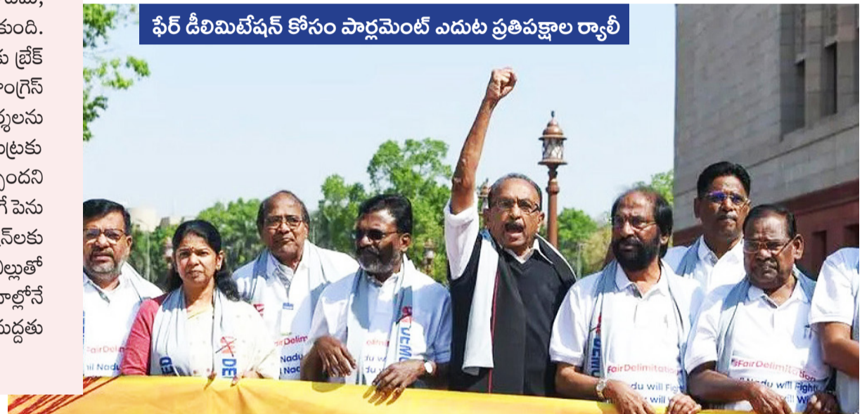
ఫేర్ డీలిమిటేషన్ కోసం పార్లమెంట్ ఎదుట ప్రతిపక్షాల రా్యభి