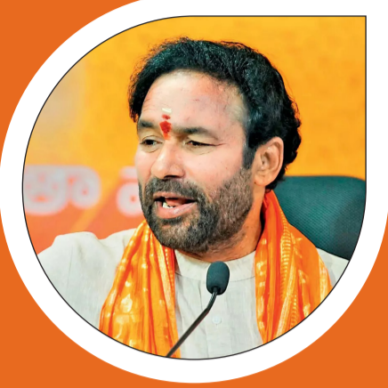
- కిషన్ రెడ్డి, కేంద్ర మంత్రి

డీలిమిటేషన్తో దక్షిణాదికి ఎలాంటి అన్యాయం జరగదు. అన్ని రాష్ట్రాలకు సమన్వయం జరగాలన్నదే కేంద్రం విధానం. సీఎం రేవంత్ రెడ్డి వితండవాదం చేస్తున్నారు. హైబ్రిడ్ నమూనా అంటూ జనాల్ని తప్పదోవ పట్టిస్తున్నారు. ఆయన చెబుతున్న హైబ్రిడ్ నమూనా.. ప్రపంచంలో ఎక్కడా లేదు. రేవంత్ రెడ్డి చెప్పిన విధానం తెలంగాణలో కూడా అమలు చేస్తారా? అప్పుడు ఆదిలాబాద్కు సీట్లు తగ్గించి, హైదరాబాద్కు పెంచుతారా? తెలంగాణ ఆదాయంలో 70 శాతం హైదరాబాద్ నుంచే వస్తున్నది. అలాంటప్పుడు 70 శాతం సీట్లు హైదరాబాద్ పరిసరాల్లోనే ఉండాలి కదా! రేవంత్ రెడ్డి ప్రతిపాదన అంబేద్కర్ విధానానికి వ్యతిరేకం. రేవంత్ చెప్పినట్లు చేస్తే, గుజరాత్కు ఎక్కువ సీట్లు వస్తాయి. కాంగ్రెస్ వాళ్లు వితండవాదం పక్కనపెట్టి బిల్లుకు సహకరించాలి.