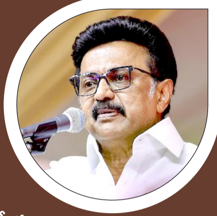
- ఎంకే స్టాలిన్, తమిళనాడు సీఎం

దక్షిణాది రాష్ట్రాల గొంతు నొక్కేలా.. ఉత్తరాది రాష్ట్రాలకు ఎక్కువ ప్రాతినిధ్యం కల్పించేలా డీలిమిటేషన్ ప్రక్రియ ఉంటే.. మొత్తం తమిళనాడు రాష్ట్రం స్తంభించిపోయేలా భారీ నిరసనలు చేపడతాం. ప్రతి కుటుంబం రోడ్డుపైకి వచ్చి పోరాడుతుంది. తమిళనాడు నుంచి మోదీకి ఇస్తున్న తుది హెచ్చరిక ఇది. తమిళనాడు ప్రయోజనాలకు భంగం కలిగించేలా నిర్ణయాలు తీసుకుంటే.. మేము చూస్తూ ఉంటాం. డీలిమిటేషన్ ప్రక్రియను కేంద్రం ఎందుకు ఇంత గోప్యంగా ఉంచుతున్నది? పారదర్శకంగా ప్రాజెక్టును ఎందుకు ప్రకటించడం లేదు? దక్షిణాది రాష్ట్రాలపై డీలిమిటేషన్ ప్రభావం ఉండదని ప్రధాని మోదీ పార్లమెంట్లో హామీ ఇవ్వాలి. ఇంత వరకు మోదీ ఎందుకు స్పందించలేదు? దీనిపై చర్చించేందుకు అపాయింట్మెంట్ కోరినా పట్టించుకోలేదు. పార్లమెంట్ ప్రత్యేక సమావేశాల్లో డీలిమిటేషన్ బిల్లును బలవంతంగా ఆమోదించుకోవాలని కేంద్రం చూస్తున్నది.