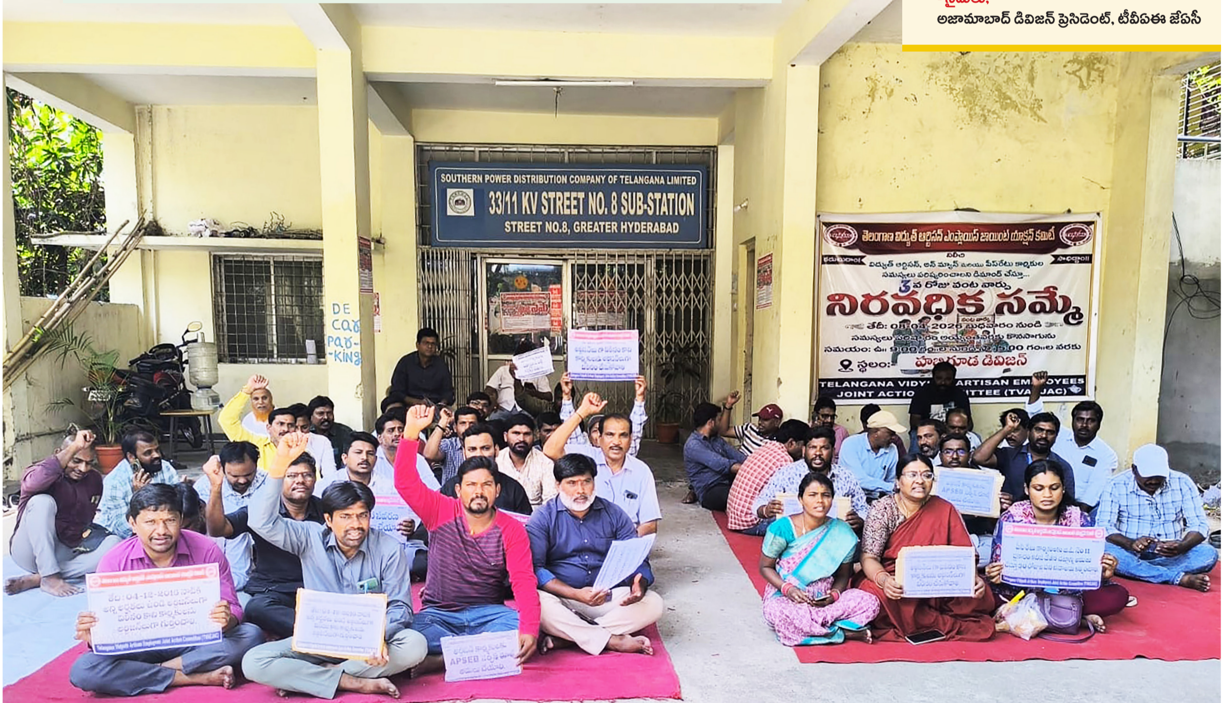
హైదరాబాద్ లోని మాజ్యగూడ డివిజన్ కార్యాలయం ఎదుట అర్జిజన్ నిరసన

ద్యుటీ చేస్తూ కరెంట్ పాక్ తో చనిపోయినా ప్రభుత్వం పట్టించుకోవడం లేదన్నది అర్జిజన్ కార్మికుల ఆవేదన. బాధిత కుటుంబానికి ఎలాంటి ఆర్థిక సాయం అందడం లేదని, కేవలం దహన సంస్కారాల ఖర్చుల కింద రూ. 25 వేలు అందుతున్నాయని అర్జిజన్ వర్కర్లు పేర్కొన్నారు. చనిపోయిన కార్మికుల కుటుంబంలో కారుణ్య నియామకం కింద ఉద్యోగం ఇస్తున్నా విద్యార్హతలకు తగిన జాబ్ ఇవ్వడం లేదన్నారు. కనీస వేతనముందే ఉద్యోగాన్ని ఇచ్చి విద్యుత్ శాఖ చేతులు దులుపుకుంటున్నదని ఆరోపించారు. "న్యాయమైన డిమాండ్లను ప్రభుత్వం దృష్టికి తీసుకెళ్లి, పరిష్కరించాలని కోరితే పెడచెవిని పెట్టింది. మరో గత్యంతరం లేని పరిస్థితుల్లో సమ్మెకు దిగితే.. టెర్మినేషన్ అన్వేషి ప్రయోగిస్తున్నది. ఎస్సా నిబంధనలను అమలు చేస్తున్నది. కాంగ్రెస్ చెప్పే ఏడో గ్యారంటీ అర్థం ఇదేనా?" అని జేపీసీ లీడర్ ఒకరు వ్యాఖ్యానించారు.