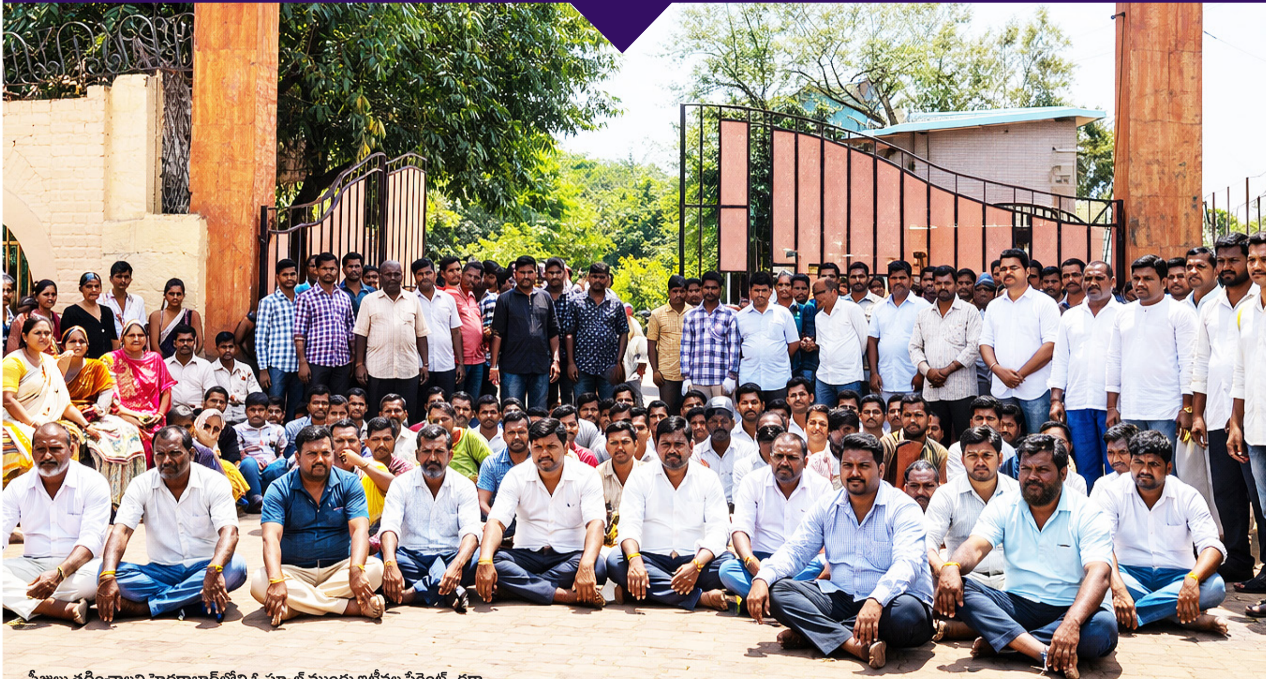
ఫీజులు తగ్గించాలని హైదరాబాద్ లోని ఓ స్కూల్ ముందు ఇటీవల పేరెంట్స్ ధర్నా

ఏటా ప్రైవేట్ స్కూళ్లు ఇష్టమున్నట్టుగా ఫీజులను పెంచుతున్నాయని పేరెంట్స్ ఆవేదన వ్యక్తం చేస్తున్నారు. కార్పొరేట్ స్కూళ్ల దోపిడీ మఠీ ఎక్కువైందని అంటున్నారు. ప్రైవేట్ స్కూళ్లు 30% నుంచి 50% వరకు ఫీజులు పెంచుతున్నాయని తాజాగా హైదరాబాద్ స్కూల్ పేరెంట్స్ అసోసియేషన్ (హెచ్ఎస్ఏపి) ఆందోళన వ్యక్తం చేసింది. ప్రైవేట్ పాఠశాలల ఫీజుల నియంత్రణకు చట్టం తెస్తామని రాష్ట్ర ప్రభుత్వం చెప్పిన్నా.. అది కమిటీల వరకే ఆగిపోతున్నదని పేరెంట్స్ అంటున్నారు. హైదరాబాద్ లోని ఉప్పల్, షేక్ పేట ప్రాంతాల్లో ప్రైవేట్ పాఠశాలలు వచ్చే విద్యా సంవత్సరానికి సంబంధించి 50% వరకు ఫీజులు పెంచడంతో తల్లిదండ్రులు ఈ మధ్య ఆందోళనకు దిగారు. స్కూళ్ల ముందు నిరసన తెలిపారు. రూ.76వేలు ఉన్న ఫీజు ఇప్పుడు లక్ష రూపాయల వరకు పెంచుతున్నారని.. ఇంతకన్నా దోపిడీ ఏముంటుందని వాపోయారు. కొన్ని తరగతులకు ఫీజు ఏకంగా రూ.3.2 లక్షలకు చేరిందని, నాలుగేండ్లలో ఫీజులు 141% పెరిగాయని వారు లెక్కలతో మీడియా ముందుకు వచ్చారు. సంగారెడ్డి జిల్లా బిర్లుదాలోని ఒక ప్రైవేట్ పాఠశాల ఎదుట తల్లిదండ్రులు ధర్నాకు దిగారు. ట్యూషన్ ఫీజుతో పాటు బుక్స్, ట్రాన్స్పోర్ట్ పేరుతో అదనంగా డబ్బులు వసూలు చేస్తున్నారని ఆవేదన వ్యక్తం చేశారు.